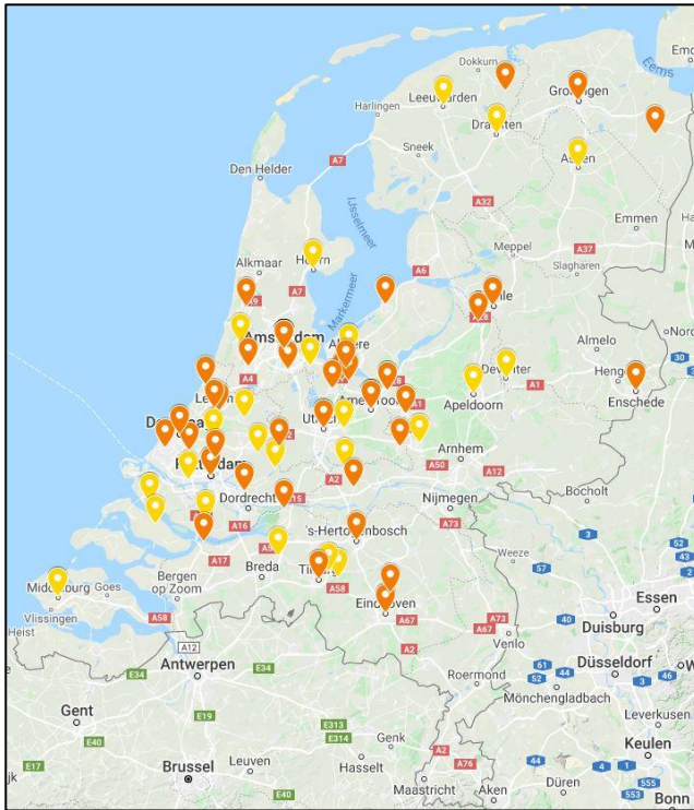
Figuur 1: Overzicht geselecteerde projecten KA1 School Education - Call 2020